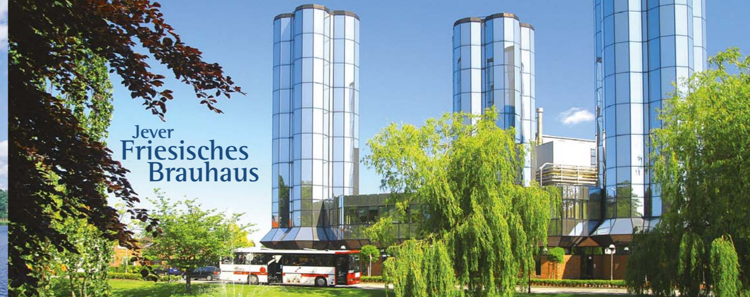
Jever Friesisches Brauhaus