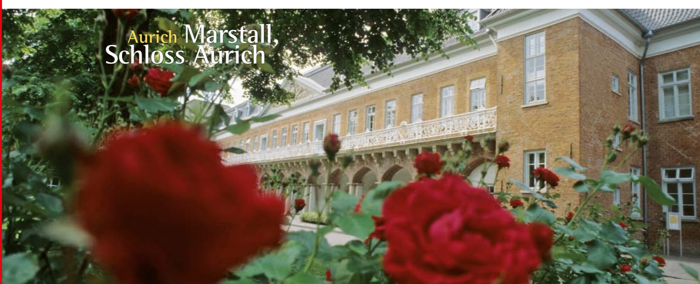
Aurich Marshall, Schloss Aurich

Auskünfte erteilt Ihnen gerne unser Serviceteam unter Tel: 0 49 41-9 33 77 oder info@urlauberbus.info . Gruppen ab 10 Personen melden sich bitte vorher an.