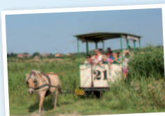
... auf der autofreien Insel.